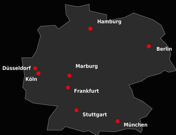
ILLUSTRATIVE INDUSTRIE- UND LOGISTIK-HUBS IN DEUTSCHLAND

Industrie-, Logistik- und Gewerbestandorte sind Teil von Lieferketten, regionalen Partnernetzen und kritischen Betriebsabläufen. Deshalb muss die Sicherheitsführung das Umfeld mitdenken - und vor Ort präzise umsetzen.